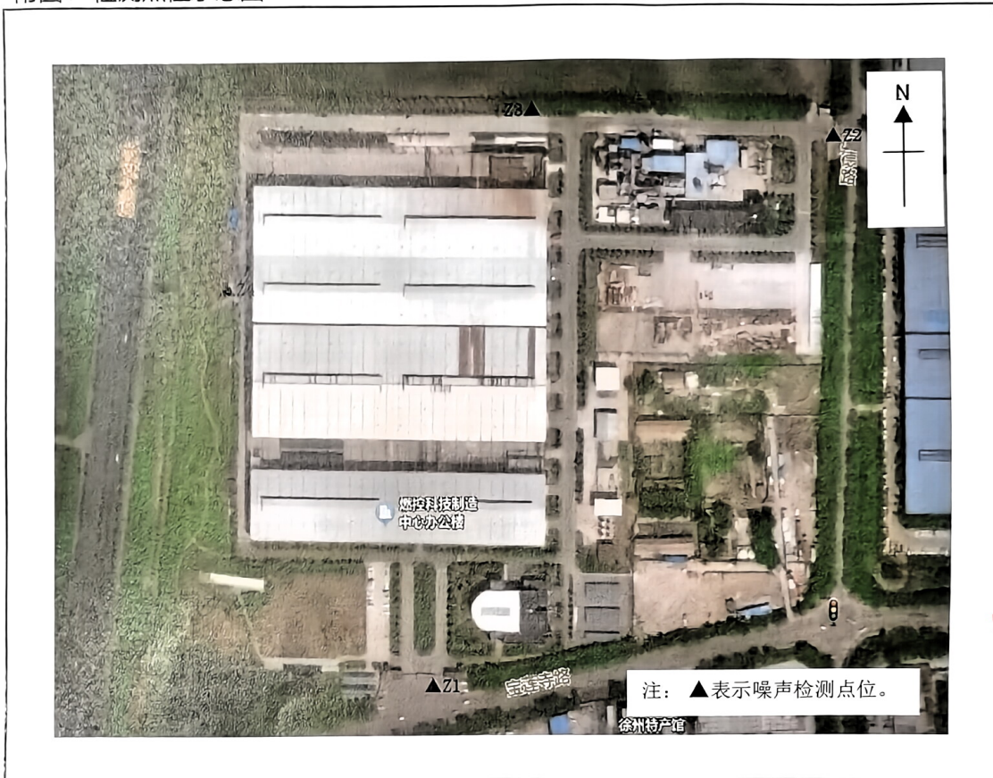
附图1 检测点位示意图